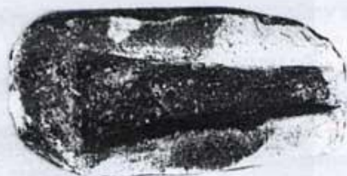
Motlle de fosa de destrals metal·liques (Orpesa la Vella).