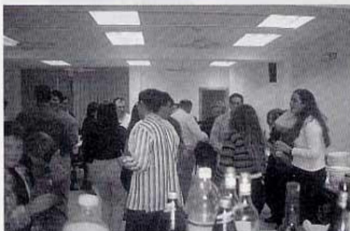
Festa de Santa Cecilia '96. 16 de novembre

El concierto reunió a numeroso público en la Casa de Cultura