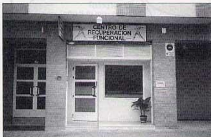
Centro de Recuperación Funcional

A primeros de año tuvo lugar la inauguración del nuevo Centro de Recuperación Funcional ubicado anteriormente en la calle Mayor, y con la nueva dirección en calle Marqués de la Ensenada 33 A bajos. Con estas nuevas instalaciones pretendemos dar una mejor asistencia