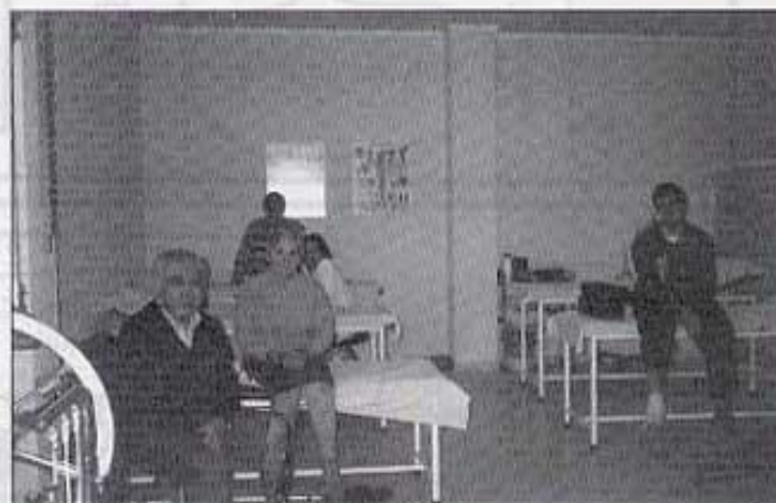
Interior del centro