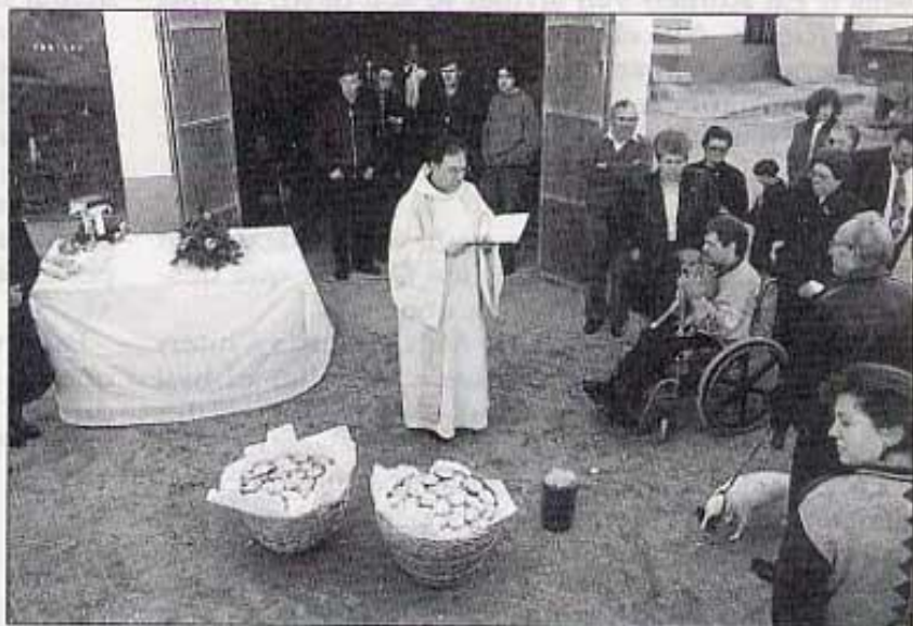
Benedicció de les coquetes

La primera vegada que es va celebrar va ser l'any 1946, "l'any de la gelà". Però era molt diferent a com se celebra ara. Es feia la missa en honor a Sant