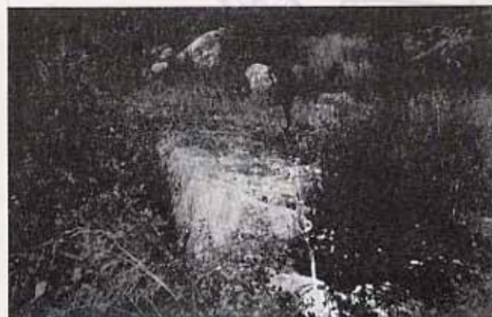
Paret de l'assut

Saragossa, morint poc després. El seu cadàver fou traslladat a Sevilla on van soterrar-lo. No va conèixer sa filla, puix va néixer poc després de la seva mort.