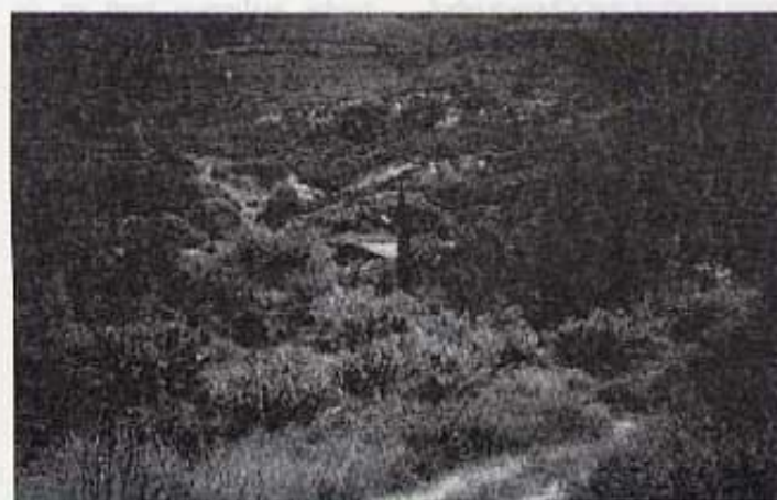
El xiprer, l'om i la teulada