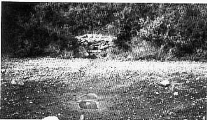
Pica i cuscin.