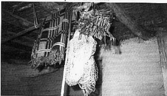
Copets i filat.

els sis pardals que revolten nervissos baix de la xarxa. Una pujada al cap i al sac. Ràpidament torna a soterrar-ho tot, mirant de no deixar cap ploma a la vista que pugui espantar als nous bevadors, i a esperar una altra volta.