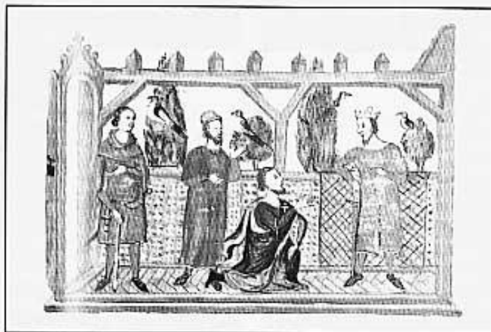
Entrevista entre En Blasc d'Alagó i el rei Jaume I. Miniatura de la còpia del s.XVII de la Crònica de Jaume I.