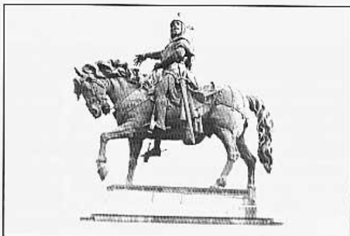
Estatua de Jaume I a València.