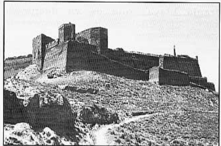
Castell de Montsó.

Es diu sempre que el rei Jaume era sobretot un home de paraula, encara quecom veurem- no sempre la va complir. Mencionarem el cas de la conquesta de Morella. Jaume I-a Alcanyís, el dia 15 de gener de 1231 - va concedir a En Blasc d'Alagó la propietat de totes aquelles places que prenguéss als moros. En