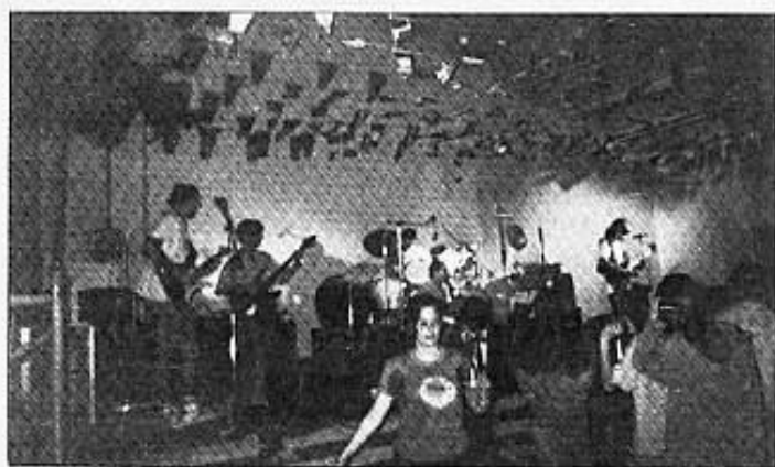
Els Kromàtics al nou local del Mas d'En Rieres.