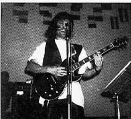
Lois "puntejant" amb fervor un blues.