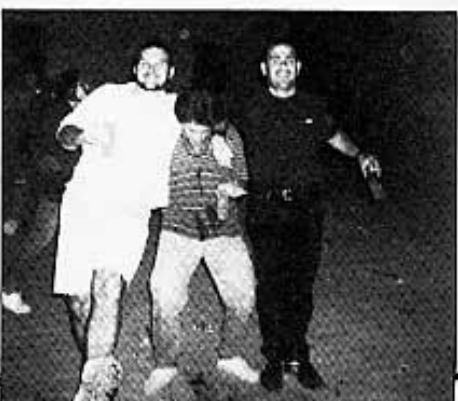
L'amable públic participatiu.

El 21 de juny passat van ser les festes de l'estiu al Mas d'En Rieres. Els KROMÀTIKS van actuar amb l'èxit habitual, i és que no hi ha res com "jugar a casa" i tindre un públic tan comprensiu i condescendent.