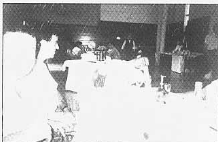
Davi ja no podia més.