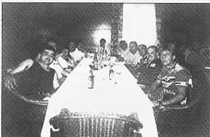
Els ciclistes encara havien de tornar cap al poble.