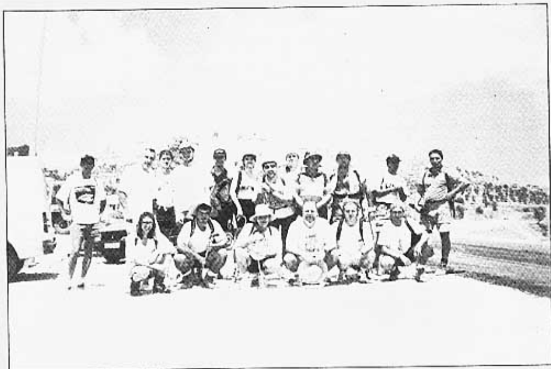
La foto de "família" amb tots els participants que anaren a peu.