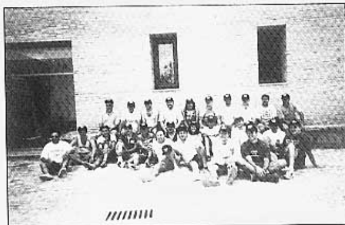
Marxistes i ciclistes, tots junts abans de dinar.