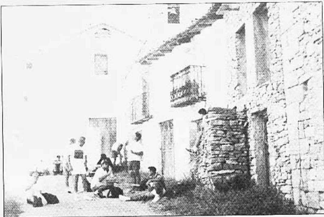
La Llèqua, on tots buscàrem una ombra per descansar.