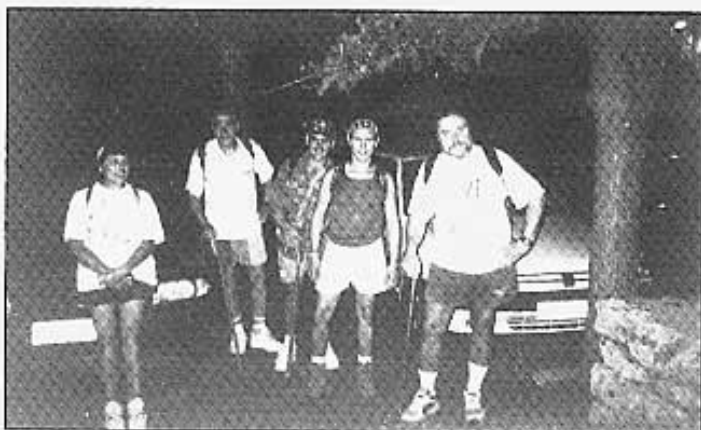
Per fi, ja estàvem a Catí.