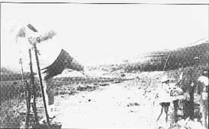
Rocher, saltant el tancat dels bous.