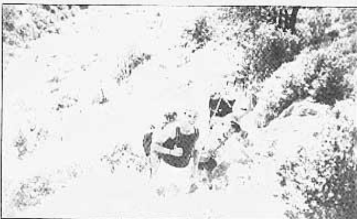
Punjant el barranc de la Valltorta.