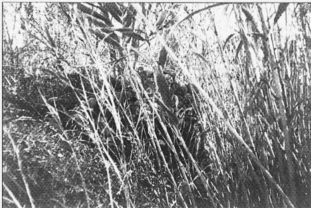
Restes del cup esborrades per les canyes.