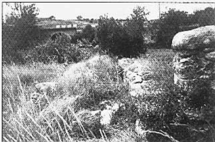
La sèquia darrere la sènia de Botiga.