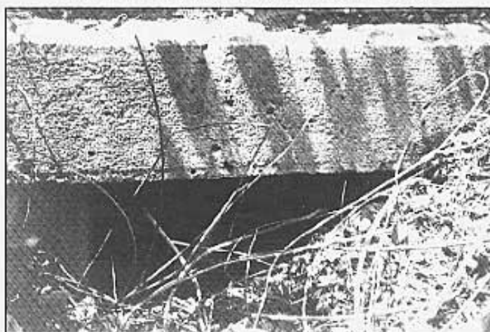
Per baix d'aquesta pedra la sèquia creuava el pont.