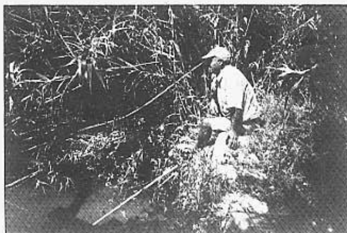
L'assut esbroquellat dins el barranc de Borrell.