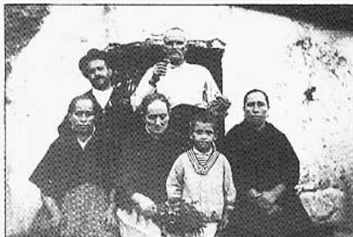
Les Coves de Vinromà. Puig Roda i família Nos.