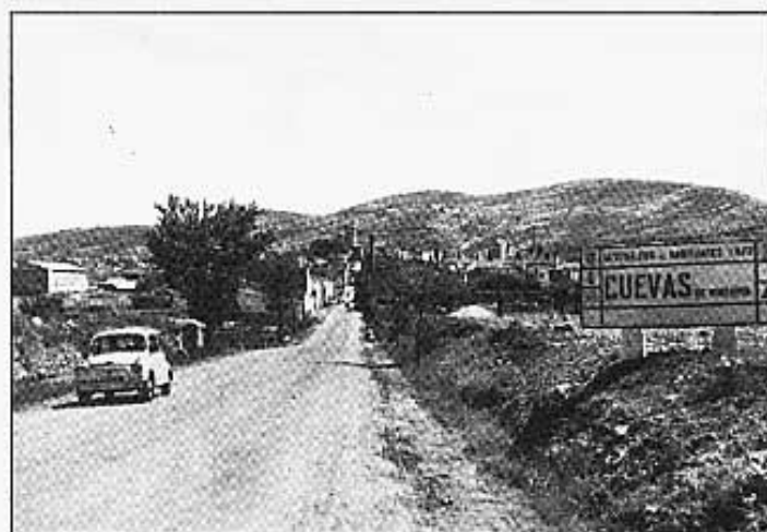
Entrada per Castelló.