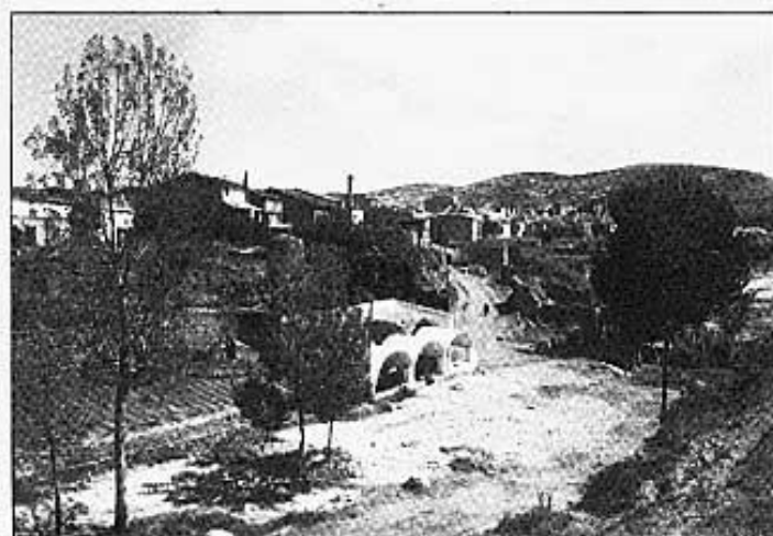
La Font de Company.