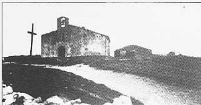
Sant Pere de Castellfort.