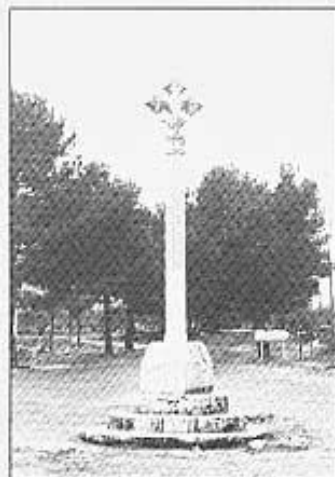
Peiró del camí de l'Avellà (Cati).

dir del romànic i gòtic rural (algunes en completa ruïna, com la de Santa Llúcia de Salvassòria, altres magníficament recuperades, com la de Sant Pere de Castellfort), peirons o creus de terme, pous de neu o "neveres" (que donaren lloc a una important indús-