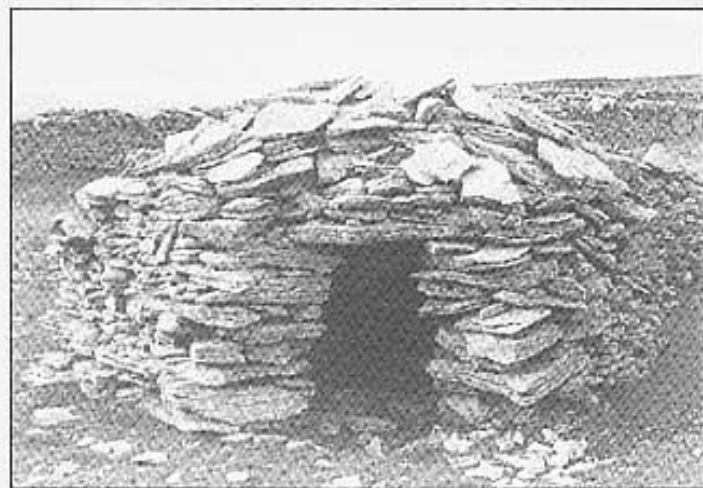
Barraca de pedra.

tria al segle XIX a l'interior de la província), pintures rupestres (tots coneixem la Valltorta, però de vegades no hem sentit parlar de les pintures de Morrellà la Vella o el Polvorí de la Pobla de Benifassà), romeries (algunes oblidades, fins i tot en la memòria col·lectiva, com la de Les Coves a Sant Miquel, altres que en canvi gaudeixen d'una ac-