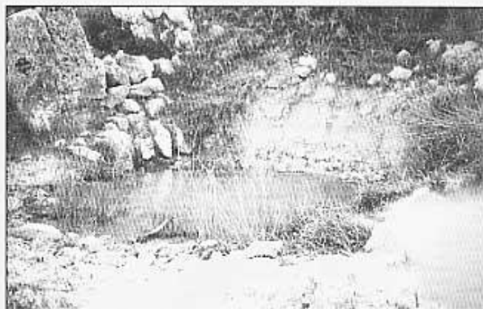
Una clotxa de les que s'hi troben