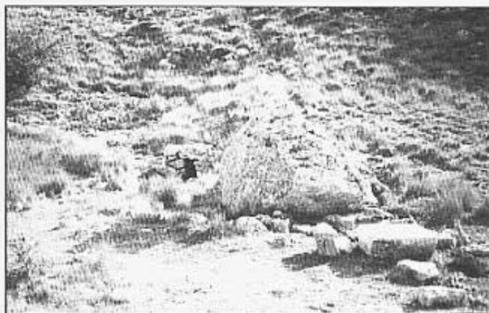
Pou i una salera