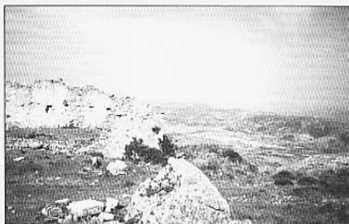
La nevera nova, una salera i Catí al fons.