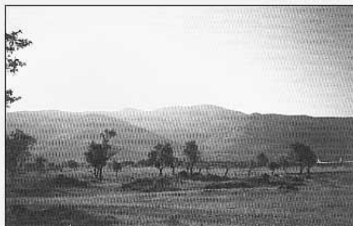
El tossal de la Nevera vist des de la carretera.