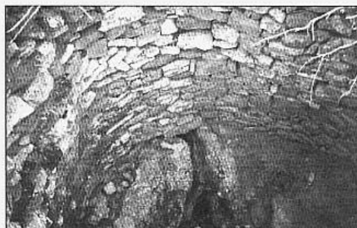
L'avenc de la Vall.