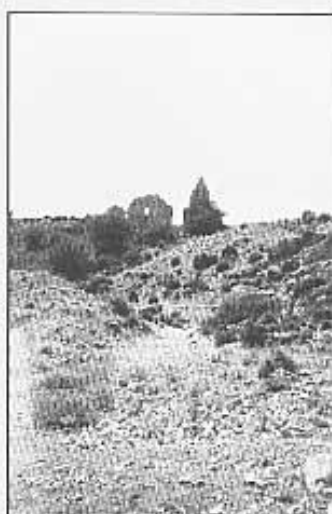
Rüines del molí.

s'hi troba l'ernita de la Verge del Pilar, zona d'embassament d'aigües que són engolides per un avenc que hi al tálveg, paredat fins la boca i envoltat d'espinals,