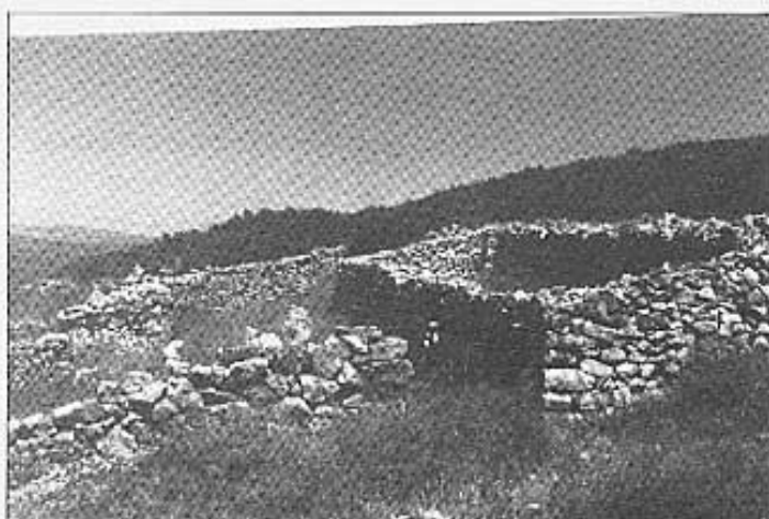
Corral de darrere del Mas.