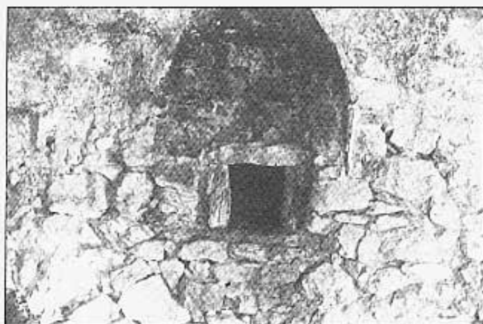
Boca del forn.