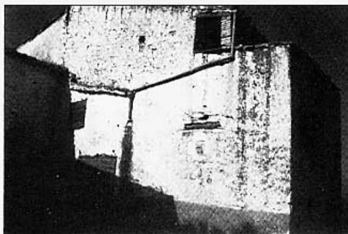
Casa de Diluvina i Vicente.