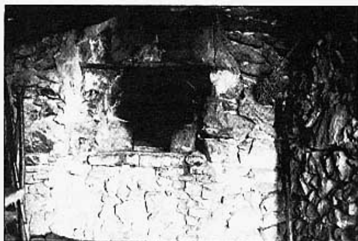
Fort del Mas.