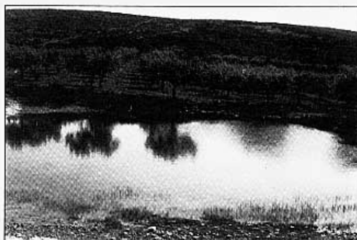
Bassa del Mas. La meitat està dins del terme de les Coves i l'altra del d'Albocàsser.

cents anys. El seu interior podeu vore'l, parcialment, en la foto de Lenyo i Sherpa. L'entrada, un pou circular d'uns dos metres de profunditat, està segellada per una reixa.