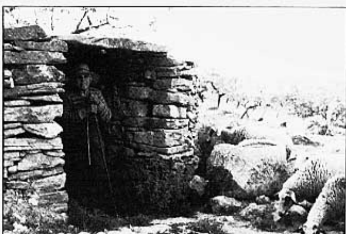
Francisca tornant de guardar.