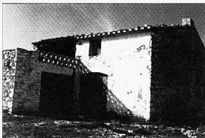
Casa de Manuela del tio Cento.