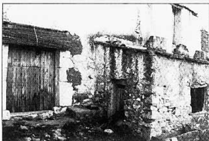
Casa d'Amadeo i Centota.