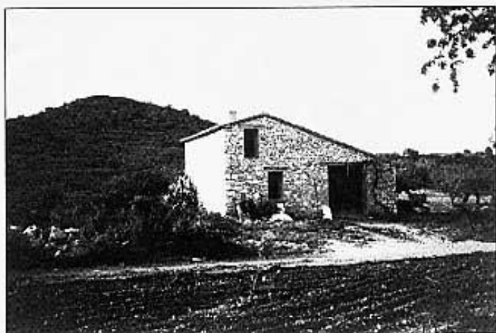
Caseta al peu del Tossalet de la Mosquera.