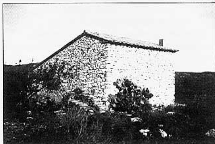
La caseta vista des d'un altre angle.