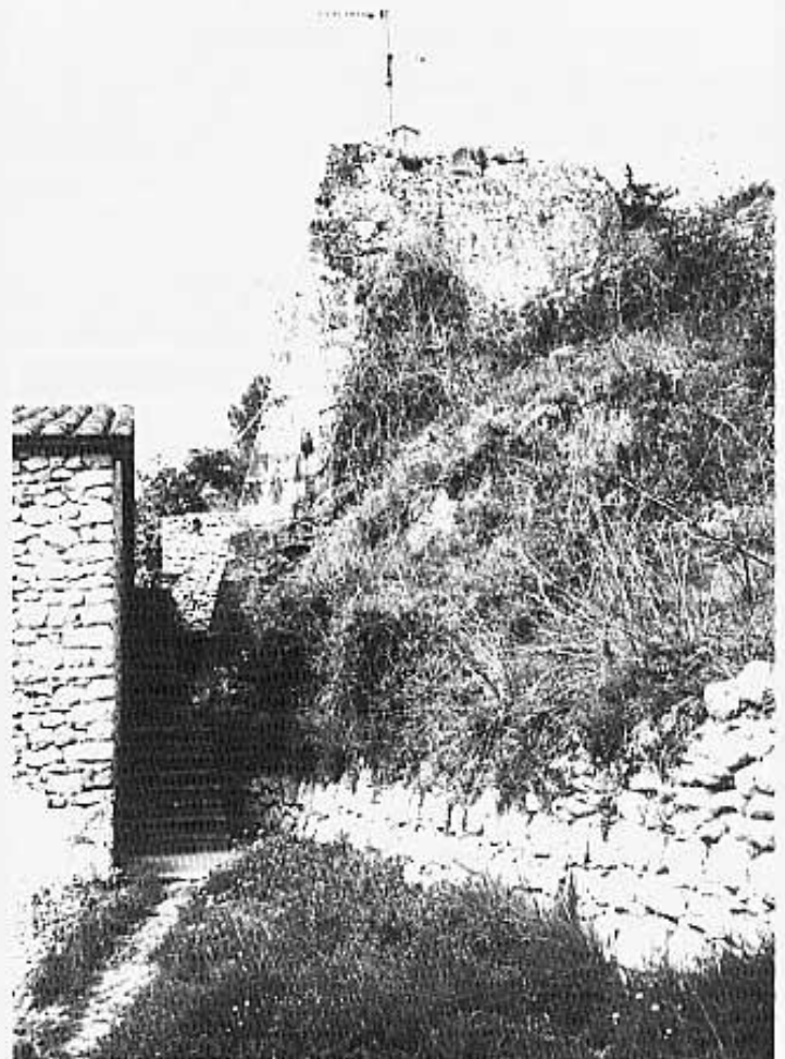
Habitatge i cap separats per una escala.