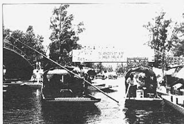
Jardines de Xochimilco.

su arquitectura, sus artes y su cultura en general.