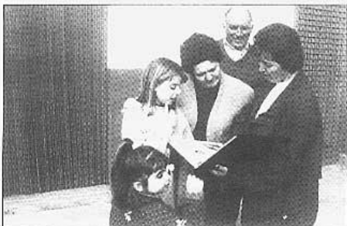
Buscant fotografies a l'àlbum.