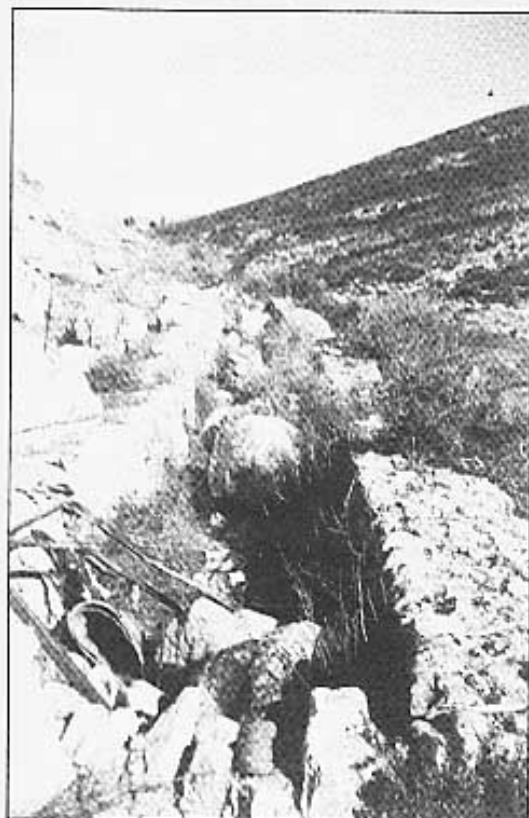
Tram de la sèquia amb poques escombraries.