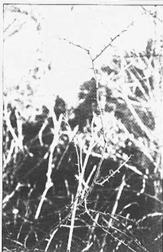
Salt del trestellador folrat de salvatge vegetació.