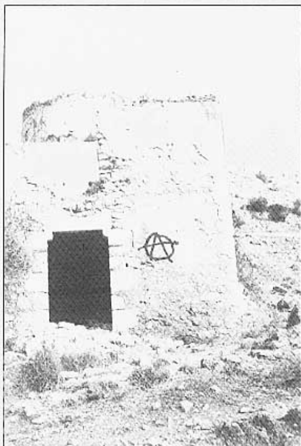
Porta del molí.