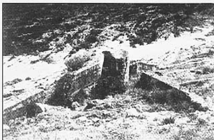
La bassa i el cup vists des del Tossal.