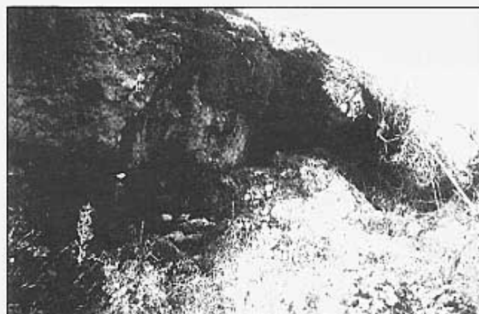
Restes de la sèquia baix de la Roca Tallada.