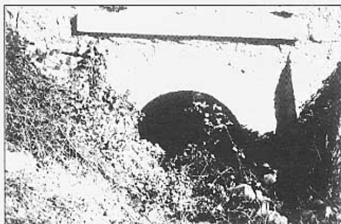
Arc de pedra a free dels tres ponts per on passava la sèquia.