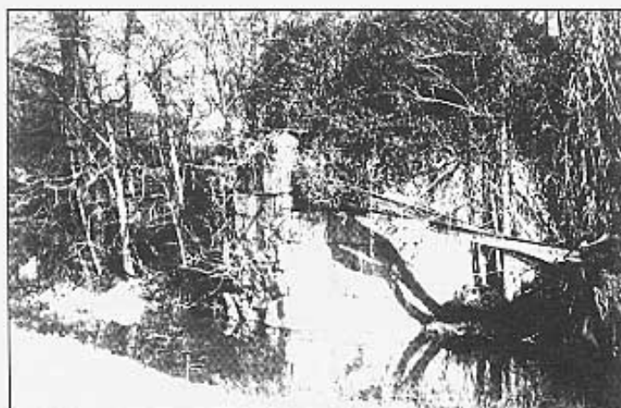
Restes de la sèquia en el barranc d'en Bern.