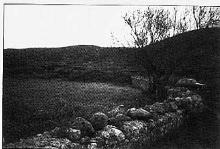
Marxant plegats bassa i ametllers maten l'avorriment.

De la porta del molí només hi resta el buit, sense llinda, llindar ni brancal. L'entrada no podia fer-se pel riu, és late-