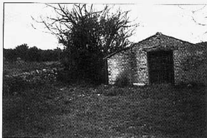
Entre la paret i la caseta passava la sèquia.

No ens queden restes que ens facin palès per on arribava el camí d'accés. Nogensmenys ens fa pensar en algun entre-