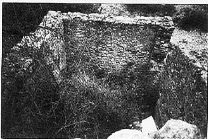
El molí sense sostre vist del camí.