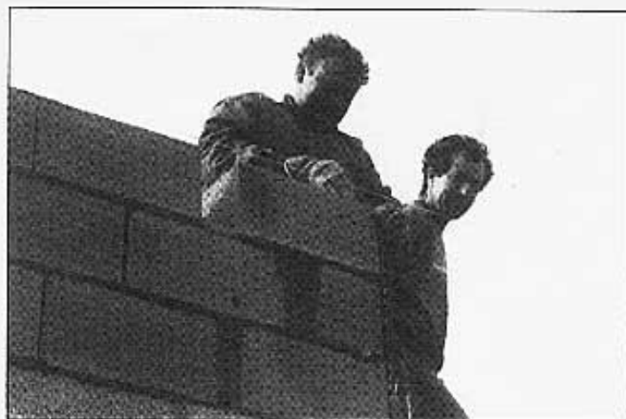
El mestre d'obres tirant el plom