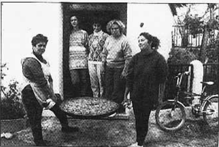
La paella del dijar