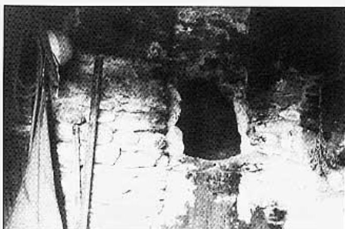
Antic forn del Mas