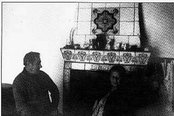
Asseguts al fumeral