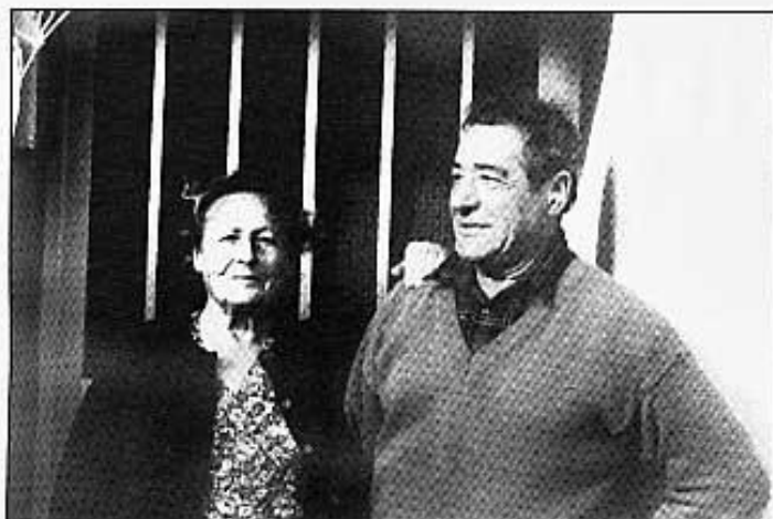
El matrimoni, a la porta del Mas