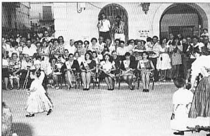
Regina i dames a la plaça.