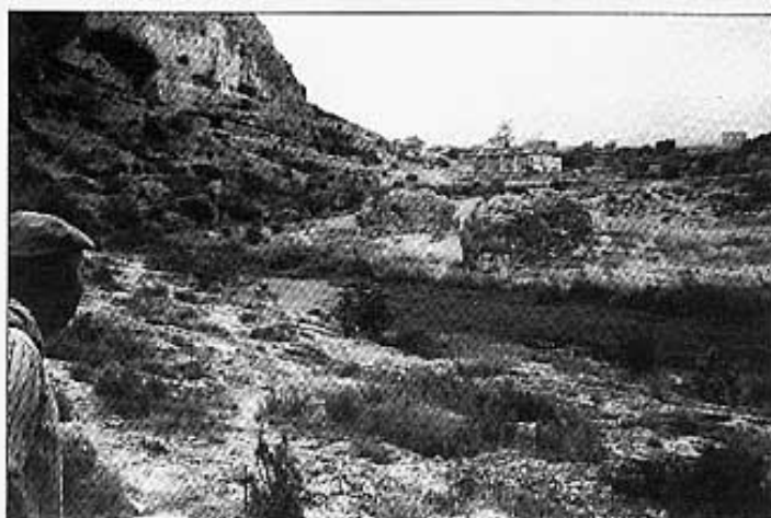
El molí vist de lluny.

"Després d'una forta riuada va quedar un tronc atrapat entre les canyes i les roques del llit del riu i jo li vaig dir a mon pare de treure'l. Després ja veuríem què em fariem. Mon pare tenia poques ganes, més tard vaig comprendre'l. Haguérem de fer moltíssima força i vam patir de debò per aconseguir apropiar-nos-en". I em digué que la taula al voltant de la que parlàvem estava feta de la fusta d'aquell tronc.