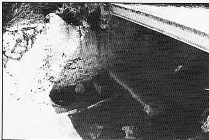
Font del mas d'en Ramona i safarçig.