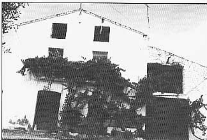
Casa de Mercedes.

En pregar-li que em conte anècdotes, situacions xocants o inversemblants que haja vist, fet, o li hagen