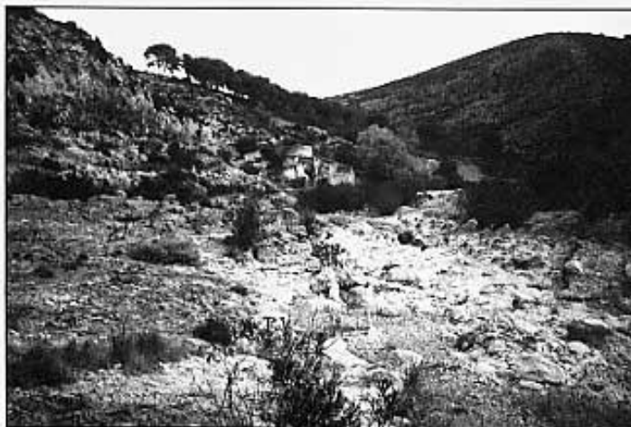
El molí vist de lluny.