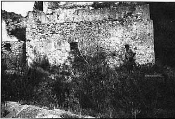
El molí vist des del riu.

pla la sèquia o s'estreny la bassa. L'estat de conservació és excel·lent, almenys, fins l'indret de la Moreria. Només caldria netejar-la a fons per engegar-la de bell nou. Cal destacar un pontet de metre i mig d'amplada per on passava el camí i una portella per