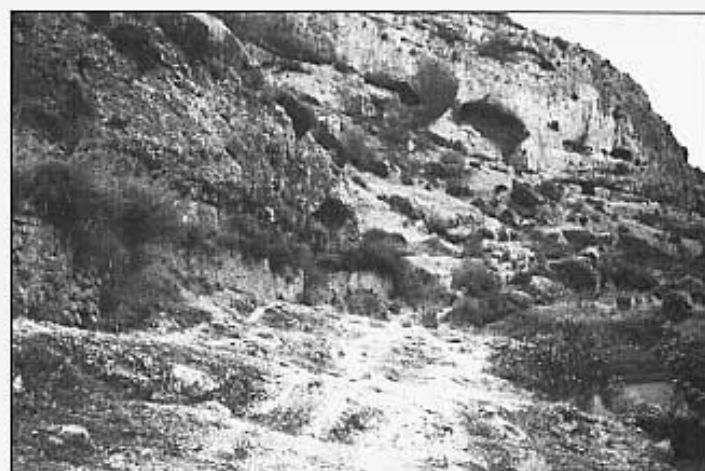
Perfil de la sèquia abans de la morenia i llúisa per on passava el camí.

Molí de dues moles. Resten encara les dues moles sota-