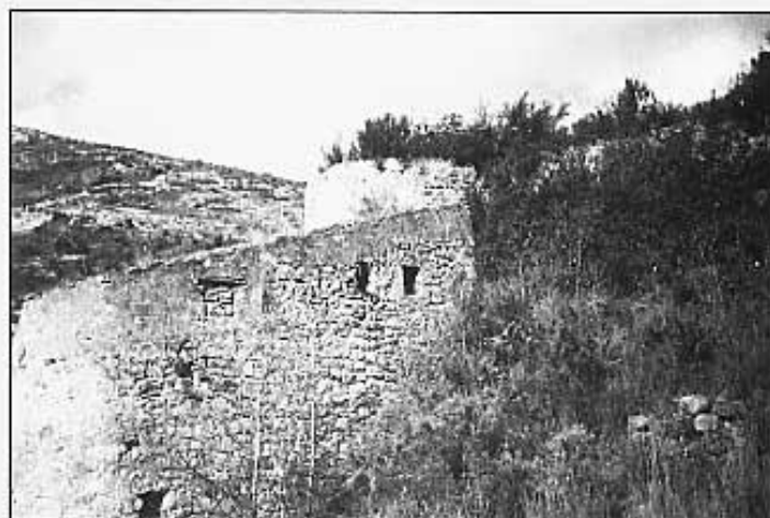
Part nord i cup envaït pels matolls.

El cup és vertical bastit amb carreus tallats a la perfecció. Pel que fa a l'alçària és prou