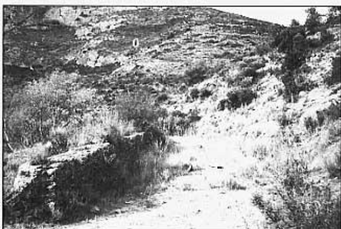
Començament d'una bassa força allargada.

La bassa és força llarga, per una banda té el recolzament de la pedra de la muntanya, per l'altra una paret molt grossa suportava la pressió de l'aigua. Abans d'arribar al cup, la seva amplària supera el metre. Té, com es pot veure en l'alçada, tres cadirals per retenir o buidar l'aigua: el del cup, el que serveix de separació entre la bassa i la petita bassa del