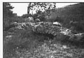
Pontet que estalvia la sèquia.

superior a la mitjana, per la qual cosa l'embranchida de l'aigua era capaç de moure bé totes dues moles. A hores d'ara la part més encimbellada del cup es veu envaïda per la vegetació espontània i bigarrada de la zona. Podem trobar-hi des d'argelagues fins un pi que, si més no, serveix per agafar-lo i no caure al buit qualsevol que vulgui pujar-hi.