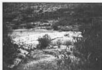
L'assut que hi ha al davant.