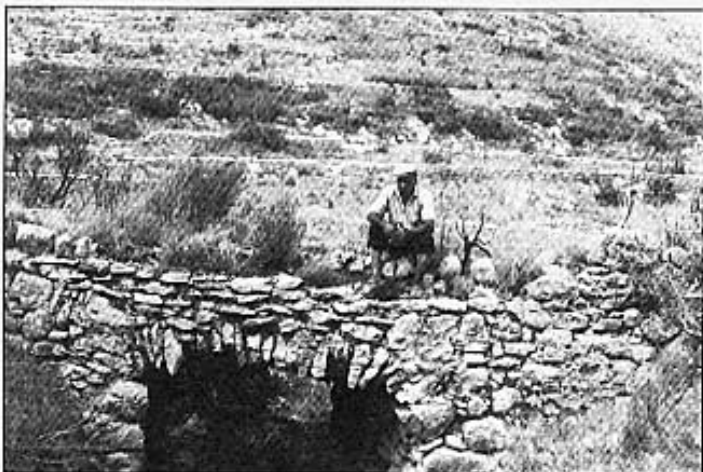
Pontet d'en Baldesco