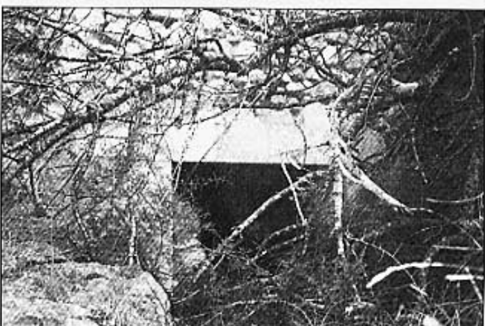
El Molí Miquel Traver Brancal d'entrada