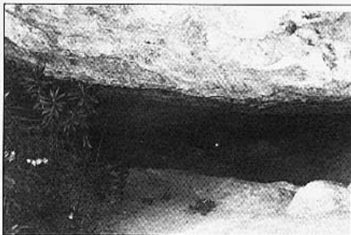
La sèquia ensorrada dins de la Cova Joana

L'arbre, al cap d'avall, acabava amb una peça de bronze en forma de con per poder girar amb menys esforç, la mateixa ai-