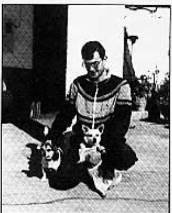
AMB FLETXA I TORNADO.