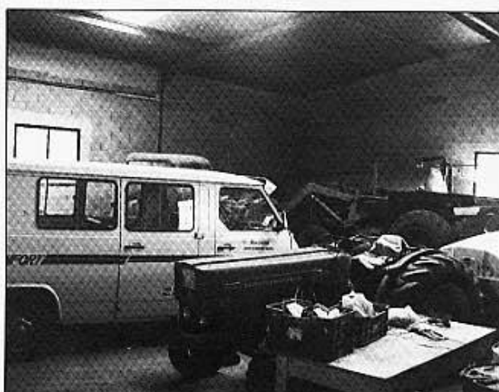
GARATGE DEL MAS.