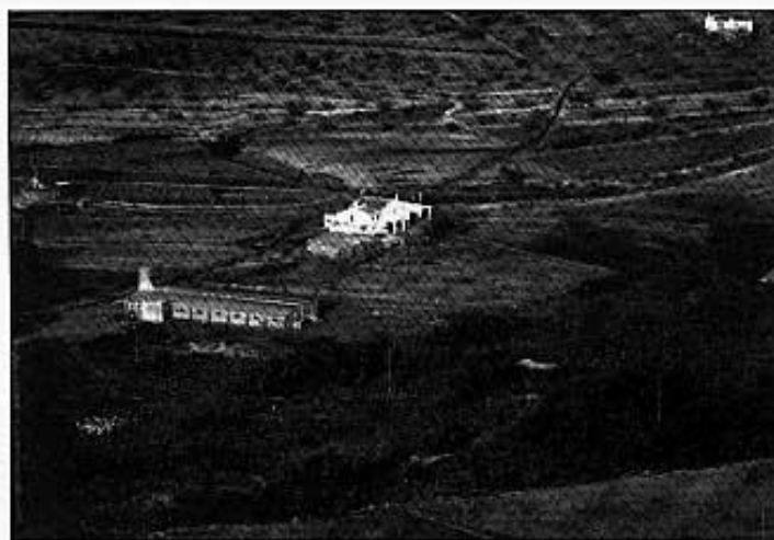
MAS DE SERAFÍ. VISTA AÈRIA, 1987