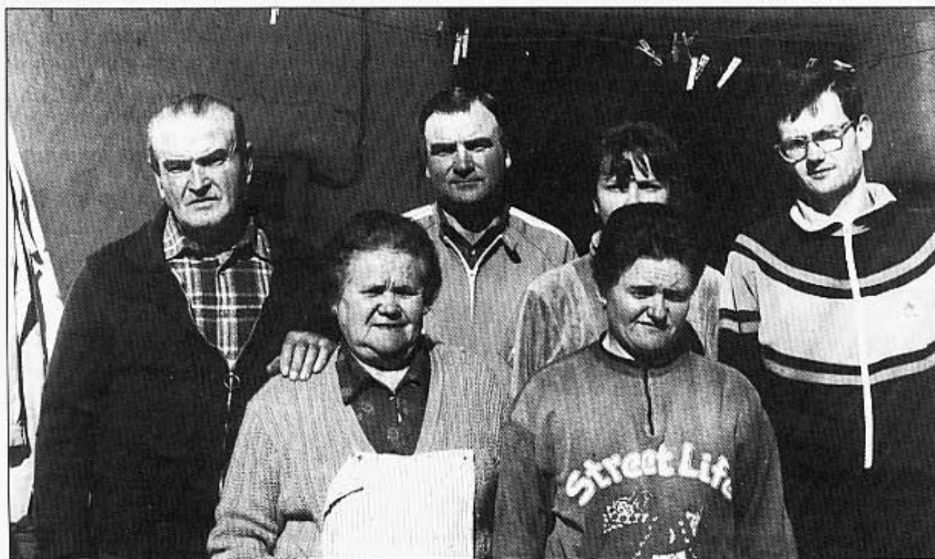
TOTA LA FAMÍLIA.