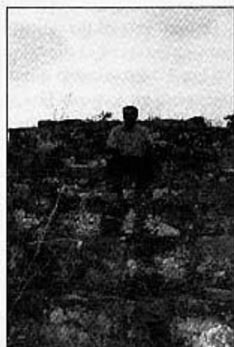
GRAONS QUE PUJEN DEL MOLÍ A LA BASSA