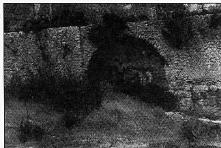
ARCADA ON LA SÈQUIA ESTÀ VIA LA ROCA TRAVESSERA