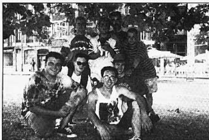
La Fira de Düsseldorf.