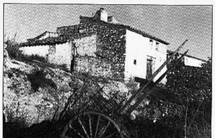
UNA PERSPECTIVA DEL MAS.