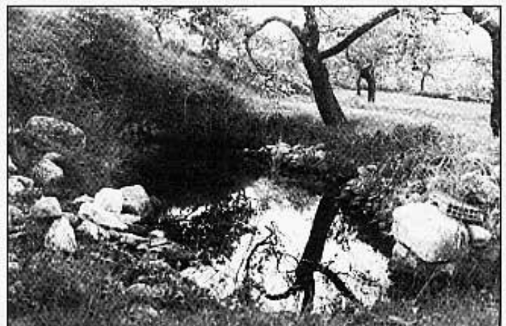
LA BASSA DEL MAS