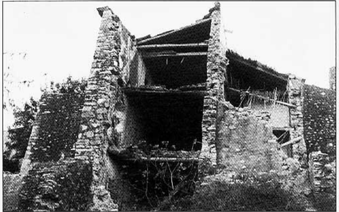
A L'HABITACIÓ DE DALT DE TOT DORMIA JO.