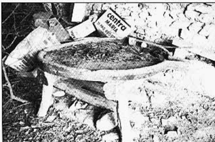
TAULA DE PREMSA.