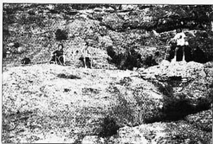
FOTO 4: Restes de la séquia del "Moli d'en Parança" que voreja la marge dreta del riu de Les Coves