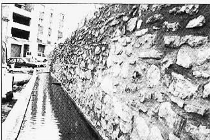
Abeuradors Font de la Vila