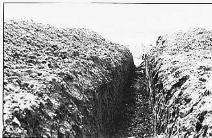
Obres del pla de regadiu

La feina serà meua per poder explicar amb quatre paraules tot el que vaig poder veure en este rutinari tomb per la vila. No se si mai havia estat el poble tan animat de obres com ara mateix. Em vaig fixar quan passava per la Sort Llerga que lo de la concentració parcelaria i el pla de regadiu va a tota marxa. Màquines per un costat, camins nous i amples, sequies, tubs per a l'aigua, es a dir, uns treballs de molta envergadura, no en va la Conselleria d'Agricultura invertirà prop de 90 milions de pessetes en les obres.