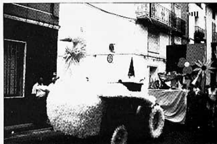
Gnomos Covarxins, segon premi.

Cal afegir altres despeses. La piro-tècnia val 800.000 ptes., el xocolate amb prims 100.000 ptes, les carrosses 270.000 ptes, els carrers 170.000 ptes.,