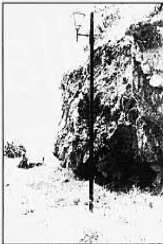
FAROLLES CAMÍ NOU

milions de pessetes. També veurem enllumenat en poc temps l'aparcament de les piscines i la pista de frontó.