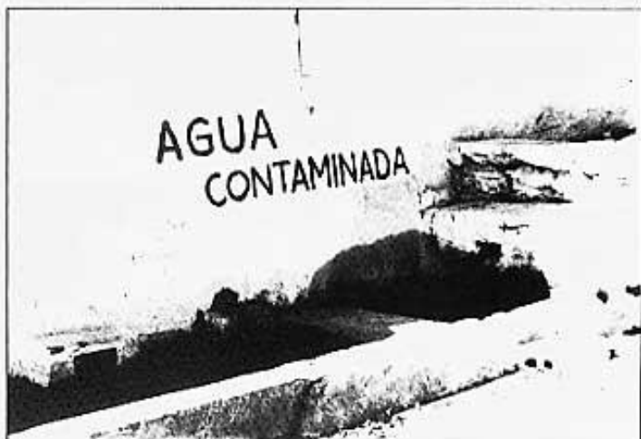
FONT DE COMPANYY