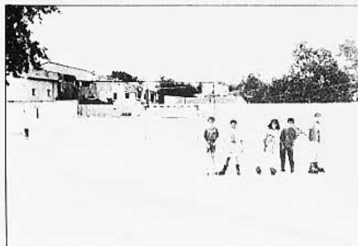
PISTA LA RAVELETA