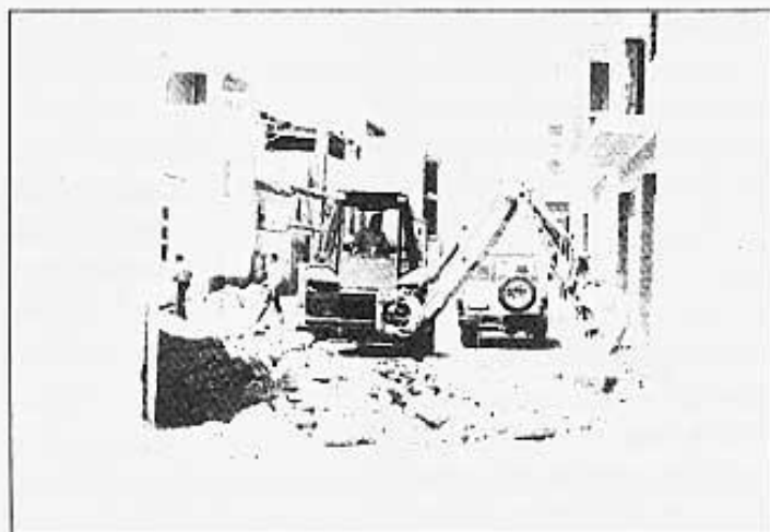
OBRES AL CARRER SANT MIQUEL

Si ens acostem fins al poliesportiu del Temple, es pot veure que també s'ha donat una maneta al camp de futbol. La construcció de nous vestuaris i l'il·luminació del camp són, entre altres coses, les obres que s'han dut a terme amb un pressupost de mes de 4