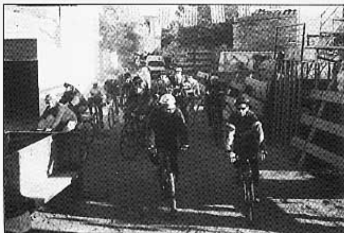
Moment de l'eixida de les bicicletes de muntanya.