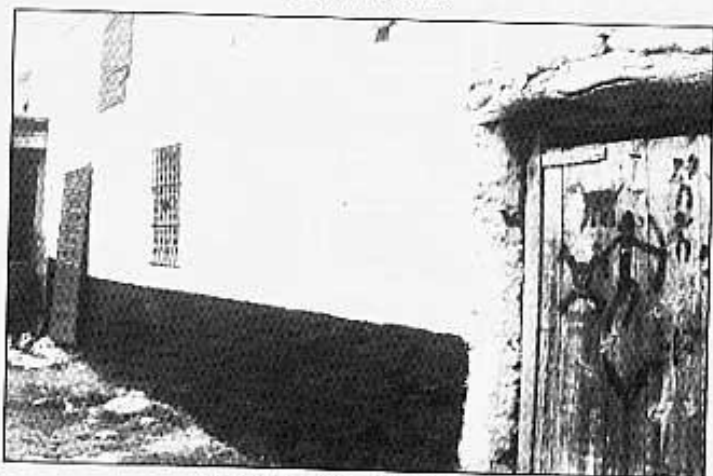
ACÍ VIVIA L'ALTRA FAMILIA.