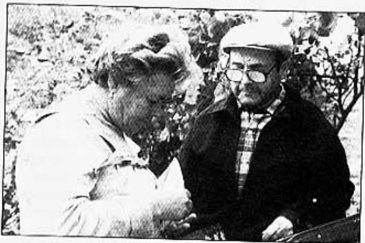
PAQUITA I ROGELIO TRIANT FOTOS.